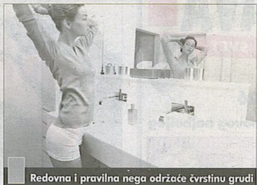
Redovna i pravilna nega održe čvrstinu grudi