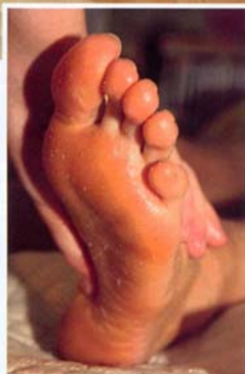
Masaža stopala, zvala se ona refleksomasaža ili bilo kako drugačije, veoma je delotvorna kod tretiranja bolesti, ali i u prevenciji

Ljubav je moj osnovni pokretač. Ja imam sreću da je moj zadatak davanje ovog beskompromisnog osećanja neposredno, kroz dodir, kroz polaganje dlanova na čoveka. Kada je naš srčani energetski centar otvoren, preko vrhova pluća, kroz energetski kanal pluća, sve do sredine dlana koja